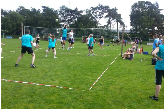
Foto: volleybalwedstrijd met 'De Schilders' tijdens het buurttoernooi Bergen 2014